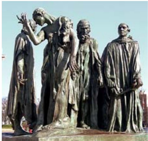
Statue Bürger von Calais

1945 ließ Zeigner eine Figur aus der berühmten Bronzegruppe Die Bürger von Calais des französischen Bildhauers Auguste Rodin in sein Arbeitszimmer im Neuen Rathaus stellen. Es war die Figur des Schlüsselträgers, der die Gruppe anführt. Es handelt