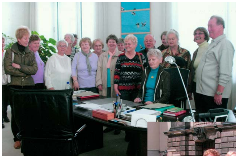
Ein Teil der Gruppe vor dem Schreibtisch des Sächsischen Ministerpräsidenten Tillich

Es sind nicht die Trümmerfrauen, sondern Gohliser Trümmerkinder des Jahrgangs 1938, die sich in Dresden zum 10. Klassentreffen in Folge nach 2001 trafen und feierten.