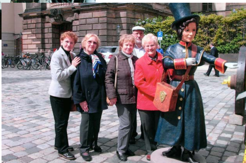
Ein anderer Teil der Gruppe auf der Führung durch Dresden

Denn Klassentreffen bedeutet für Alle: Leipzig, ihr Ort der Jugend, ist immer noch ihre Heimat - es ist nicht nur eine wunderbare Stadt, sondern ein Gefühl von Kindheit und Ausgelassenheit. Und auf diesen Klassentreffen suchen und fin-