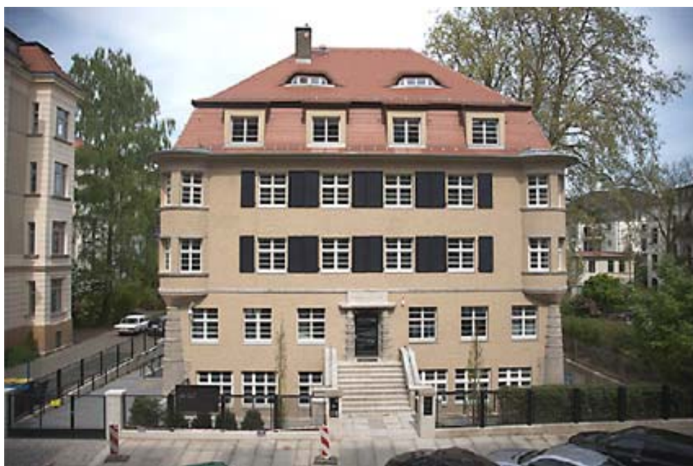
Ariowitsch-Haus Hinrichsenstraße 14